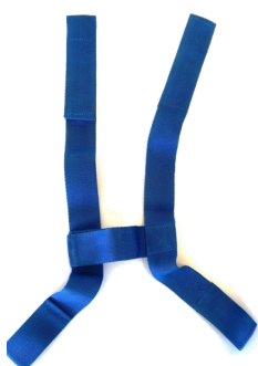
491011 Ceinture de sécurité 4 points.

Les références précédées d'un « S » (standard) désignent les équipements inclus dans le tarif de base.