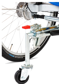
491046 Roue anti-bascul détachable