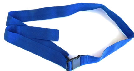
491012 Ceinture pelvienne