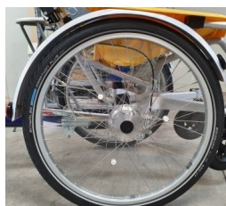
491003 Flasques de roues pour fauteuil roulant, transparentes et résistantes