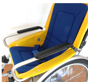
491006 Accoudoirs surélevés, capitonnés et amovibles