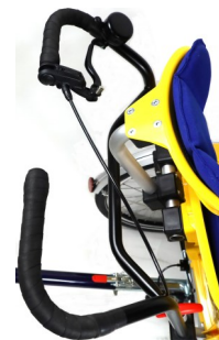
Vue du guidon avec sonnette et poignée de freins