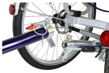
Standard : désaccouplement vélo-fauteuil