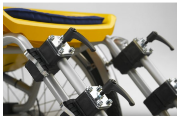
491023 Repose-pieds à attache rapide