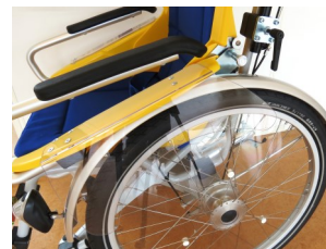
491007 Protection pour les mains